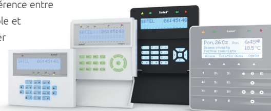
INT-KLCDL-BL, INT-KLCDR-BL, INT-KWRL2-BSB, INT-KSG-SSW

Préférez-vous commander le système à l'aide des touches ? C'est une méthode accessible à tous les membres de famille, indépendamment de l'âge et de la forme physique. L'offre comprend des claviers traditionnels (p. ex. INT-KLCDL , INT-KLCDR , INT-KWRL2 ) et un modèle unique d'un clavier avec écran tactile ( INT-KSG ) contenant des solutions modernes dans une forme classique et attrayante. Quelle est la différence entre ce dernier et des autres ? Un grand écran graphique lisible et des touches en forme de champs répondant au toucher permettent une utilisation pratique dans toutes les situations. Un menu intuitif facilite l'accès aux fonctions les plus fréquemment utilisées ainsi qu'aux tâches liées à la domotique. Grâce à cela, au lieu d'appuyer de manière répétée sur les touches, vous pourrez activer une séquence de commandes en une seule pression sur le clavier.