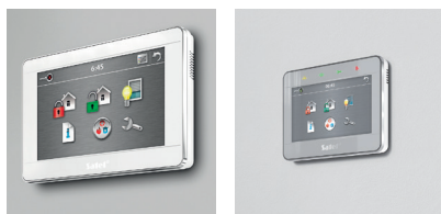
INT-TSI-BSB, INT-TSH-WSW, INT-TSG-SSW

Aimez-vous utiliser des solutions technologiques modernes ? Choisissez l'un des modèles de clavier tactile : INT-TSI (7"), INT-TSH (7") ou version compacte INT-TSG (4.3"). Un écran capacitif en verre résistant aux rayures garantit un bon fonctionnement et une réponse immédiate à votre toucher. Une interface graphique intuitive facilite l'utilisation quotidienne du système simplifiant l'introduction de commandes en quelques pressions de l'écran, et le design moderne des appareils en fera une décoration supplémentaire de votre maison ou de votre bureau.